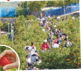
いちご狩り・みかん狩り体験