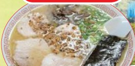
熊本元祖・玉名ラーメン