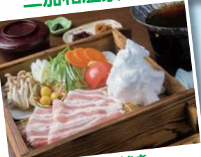
くまもつ豚すき焼き